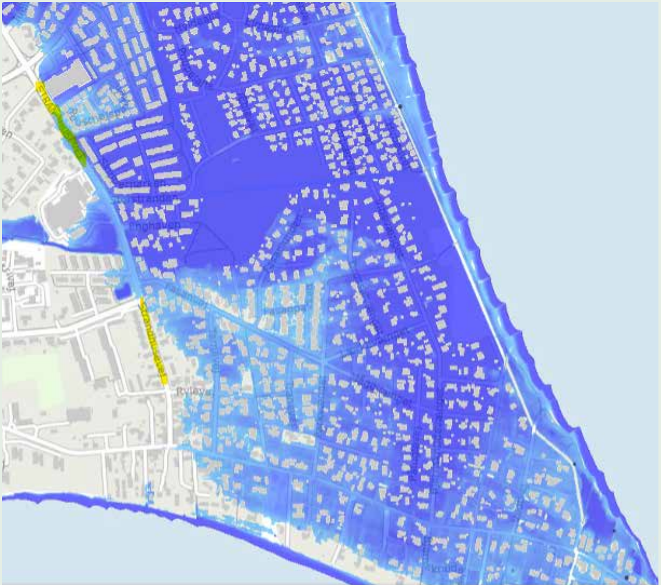
Figur 2 Forventede oversvømmelser i Juelsminde. De blå områder forventes at blive oversvømmet med den varslede vandstand. Det er disse områder, der skal evakueres i casen.

Kortene indeholder data fra Styrelsen for Dataforsyning og Infrastruktur, skærmkort fra datafordleren, DHM/Terræn (0,4 m grid) hentet 19-08-2016, GeoDanmark DHM/Hydrologiske tilpasninger hentet 28-08-2023 og GeoDanmark, Bygninger hentet 19-07-2019 samt SDFE Havvand på land fra KAMP - et Klimatilpasning- og Arealanvendelsesværktøj til Miljø- og Planmedarbejdere hentet 1.12.23.