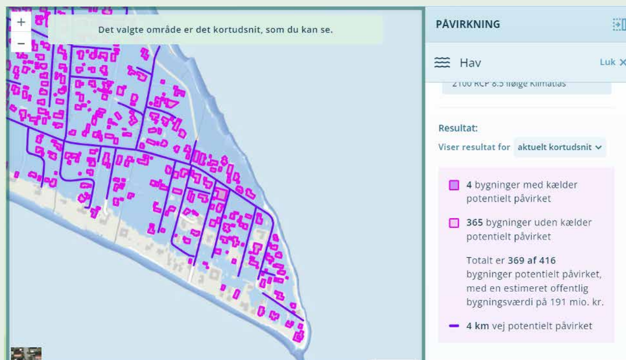
Figur 4 Vurdering af antal bygninger, der skal evakueres fra KAMP på klimatilpasning.dk.