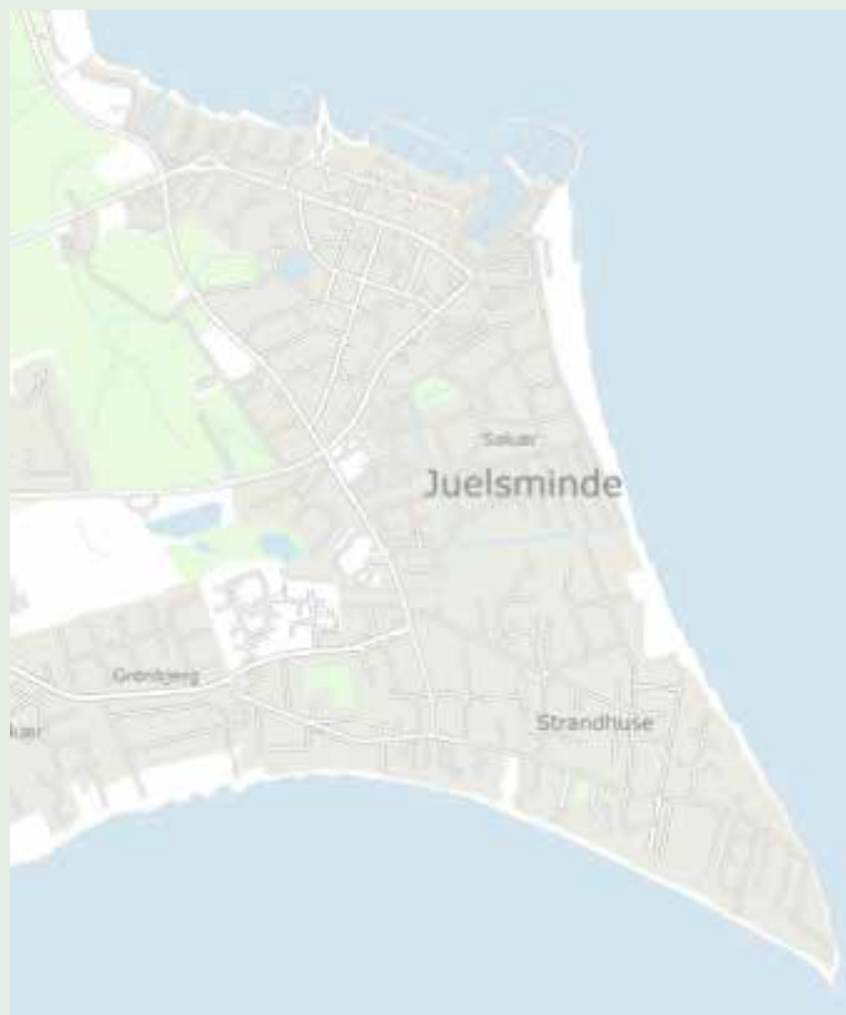
Figur 1 Kort over Juelsminde, der angiver områderne Søkær og Strandhuse.

Kan der gennemføres en mere effektiv indsats ved at tage imod tilbuddet fra medlemmerne af sejlklubben?